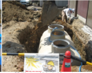
設備は天井から地下まで