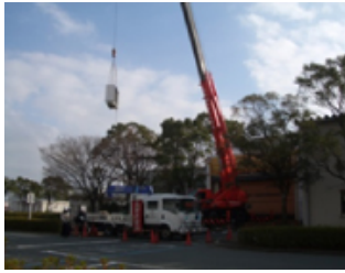
クレーンなど機械も使用します