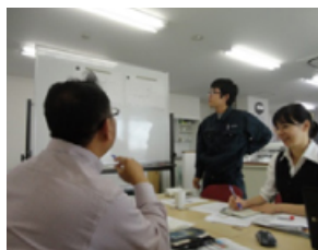
打ち合わせはワイワイ真剣に