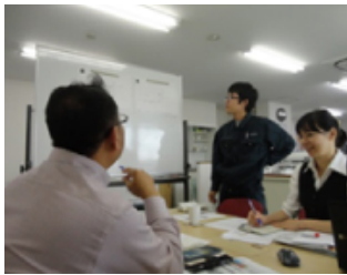
打ち合わせはワイワイ真剣に