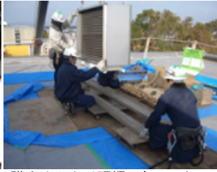
職人さんとは現場で缶コーヒー