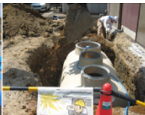
設備は天井から地下まで