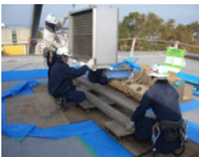
職人さんとは現場で缶コーヒー